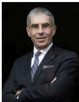
Christophe Demerson, Président de l'UNPI